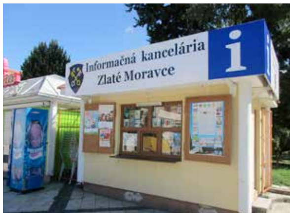
Informačná kancelária Zlaté Moravce.

Pokiaľ bude samospráva so žiadosťou úspešná a tieto peniaze získa, v rámci rekonštrukcie kaštieľa by malo dôjsť aj k zriadeniu stálej – celoročnej Informačnej kancelárie v priestoroch jeho prízemja.