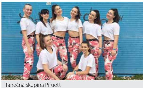
Tanečná skupina Piruett

„Keďže sa to nekoná na Slovensku, je to pre nás veľký problém. Takéto súťaže si vyžadujú