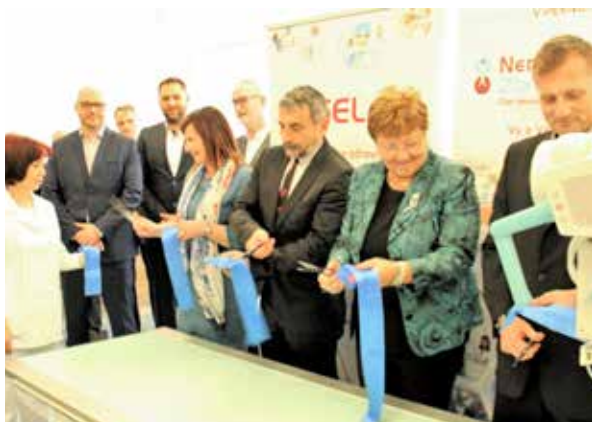
Slávnostné otvorenie rádiologického oddelenia.

Nemocnica Zlaté Moravce, člen skupiny AGEL, 14. marca 2018 slávnostne otvorila obnovené rádiologické oddelenie. Nanovo vybudované oddelenie vzniklo vďaka kompletnej rekonštrukcii, ktorá si vyžiadala finančné prostriedky v hodnote takmer 150-tisíc eur. Investícia do zakúpenia nového RTG skiagrafického prístroja predstavuje viac ako 117-tisíc eur.