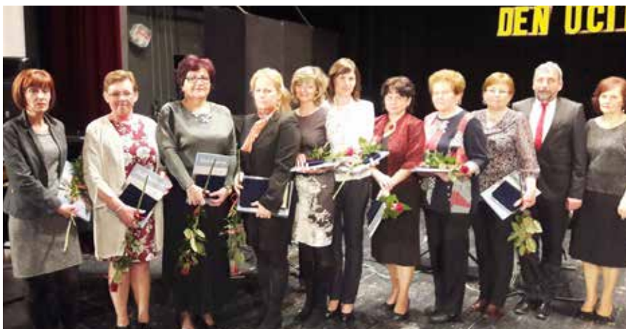
Ocenení pedagogickí i nepedagogickí zamestnanci škôl.

Deň 28. marec – pre niektorých možno iba jeden z prvých jarných dní. Ale pre nás – pedagogických zamestnancov je to jeden z dní, ktorý je výnimočný. Pripomíname si odkaz veľikána pedagogiky Jána Ámosa Komenského. Po stáročia sa vraciame k jeho myšlienkam, vzdávame hold jednému z najušľachtilejších povolání, povolaniu učiteľa. Bol jedným z prvých, ktorí začali zápas za poskytnutie vzdelania ľuďom bez rozdielu pohlavia, rasy a sociálneho postavenia. Presadzoval ideu názorného vyučovania, žiadal psychologický prístup k vyučovaniu i k samému žiakovi. Bol hlboko presvedčený o tom, že dobrá škola robí človeka lepším. V jeho ideách, humanizácii a demokratizácii školy pokračujú učelia i dnes.