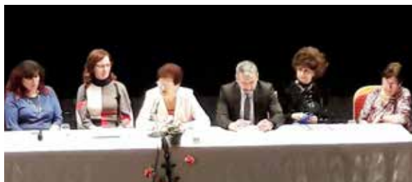
Schôdza ZO JD Zlaté Moravce.

V piatok 9. marca 2018 sa v divadelnej sále Mestského strediska kultúry a športu uskutočnila výročná schôdza Základnej organizácie Jednoty dôchodcov (ZO JD) Zlaté Moravce. Priamo na stretnutí malo dôjsť aj k zvoleniu novej predsedníčky alebo predsedu, k tomu však nakoniec nedošlo.