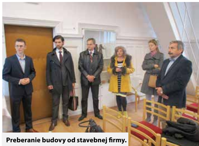
Preberanie budovy od stavebnej firmy.

Ako ďalej uviedol, na budove sa celkovo vykonala rekonštrukcia vykurovania, osvetlenia, zmena spôsobu ohrevu teplej vody, urobilo