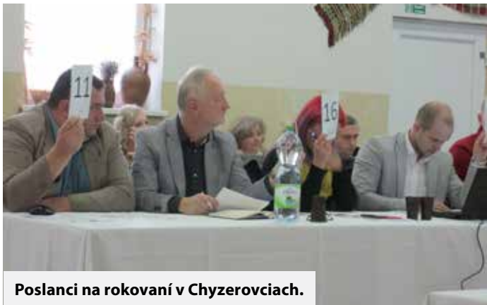
Poslanci na rokovaní v Chyzerovciach.