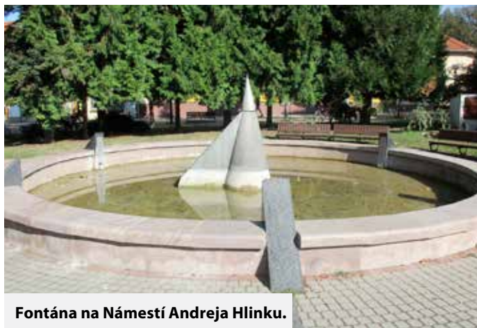
Fontána na Námestí Andreja Hlinku.