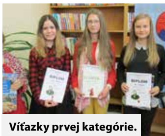
Vítazky prvej kategórie.

Miestny odbor Matice slovenskej Zlaté Moravce (MO MS) v spolupráci s mestom, Mestským strediskom kultúry a športu a Mestskou knižnicou zorganizovali dňa 19. októbra druhý ročník súťaže v prednese poézie „revolučných autorov“.