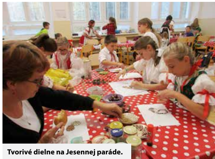
Tvorivé dielne na Jesennej paráde.

Keďže išlo o podujatie s nádychom ľudových tradícií, nesmeli chýbať ani kroje z nášho regiónu. Tie tu mali oblečené viacerí ľudia. „Veľmi sa mi páči, ako sa všetci nadchli pre tú myšlienku prísť v krojoch. Pedagogický zbor prišiel