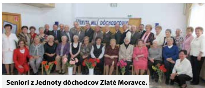
Seniori z Jednoty dôchodcov Zlaté Moravce.