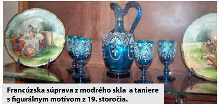
Francúzska súprava z modrého skla a taniere s figurálnym motívom z 19. storočia.