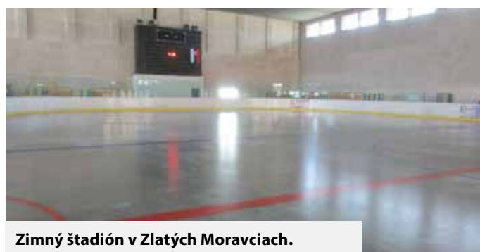
Zimný štadión v Zlatých Moravciach.

Cenník ostáva nezmenený. Verejnosť platí dve eurá, nekorčuľari jedno euro. Skupiny platia za prenájom celej ľadovej plochy v piatok a cez víkend 100 eur a v ostatné dni v týždni 90 eur. Ceny sú za jednu hodinu. „Všetky školy z mesta i okolitých obcí môžu chodiť doobeda