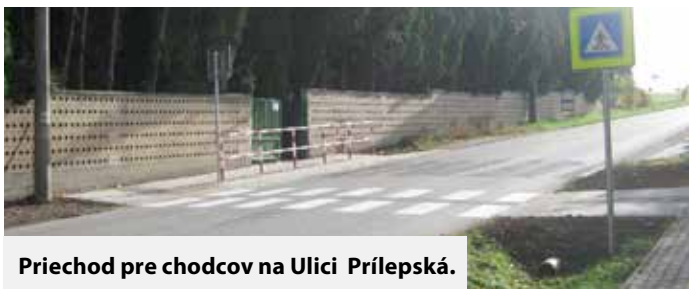
Priechod pre chodcov na Ulici Prílepská.