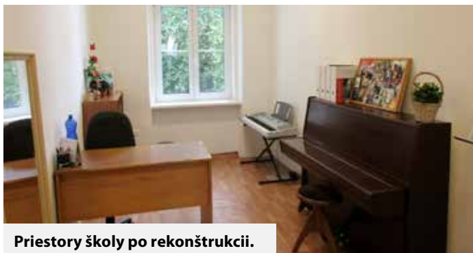
Priestory školy po rekonštrukcii.