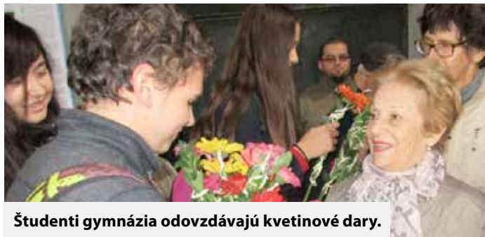
Študenti gymnázia odovzdávajú kvetinové dary.

Prítomní si vypočuli i krátku prednášku o židovskej komunite