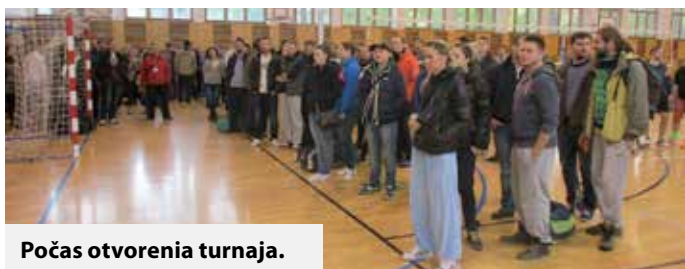
Počas otvorenia turnaja.