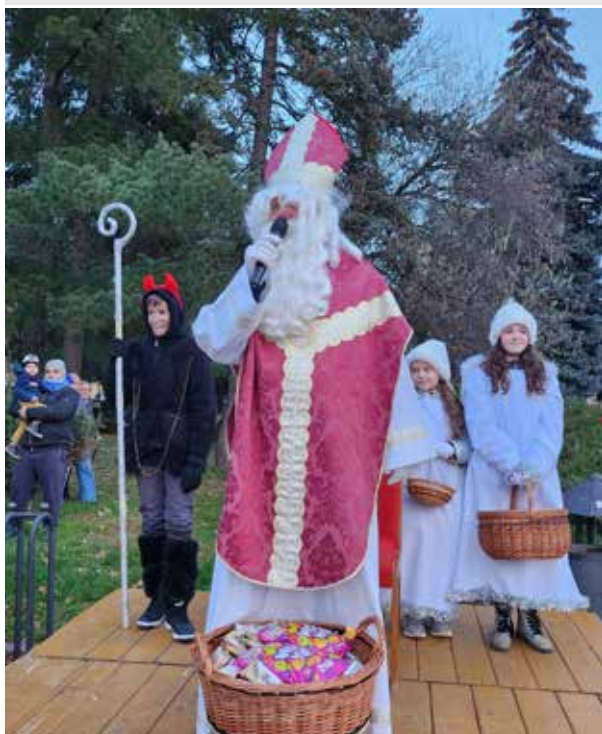
Druhá adventná nedeľa, Mikuláš.