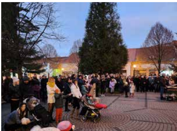
Prvá adventná nedeľa.