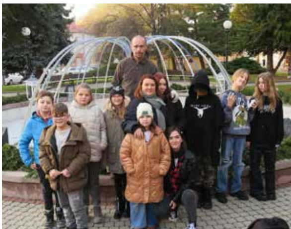
Žiaci ZUŠ, ktorí sa postarali o výzdobu venca.

V nedeľu 11. decembra 2022 sa na námestí zapálila tretia adventná sviečka. Tento akt bol tiež spojený s kultúrnym programom. Vystúpil