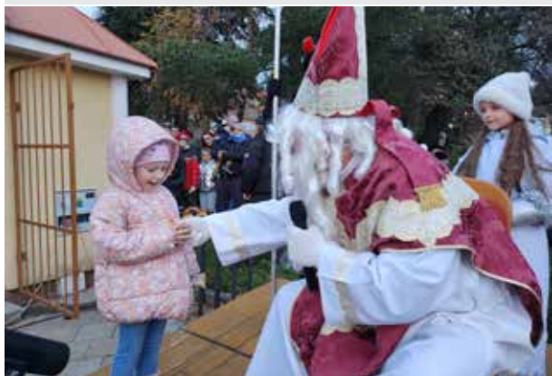
Druhá adventná nedeľa, príchod Mikuláša.