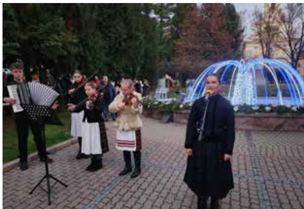
Prvá adventná nedeľa, DFS Zlatňanka.