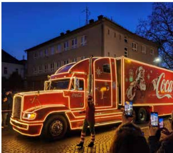
Štvrtá adventná nedeľa, príchod Vianočného kamiónu.