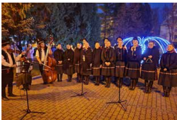
Prvá adventná nedeľa, FS Inovec.