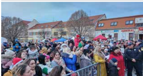
Druhá adventná nedeľa.