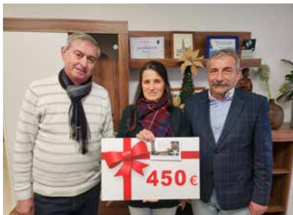
Odovzdanie šeku pre OZ Mami oáza.